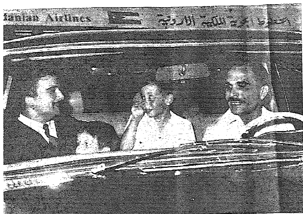
جلالة الحسين العظيم وسمو الامير الحسين ولي العهد العظيم في السيارة لدى مغادرتها مطار عمان وسيروا اصحاب سمو الامير عبد الله وتفضل بجلا جلالته الملك العظيم